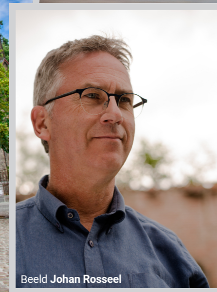
Beeld Johan Rosseel