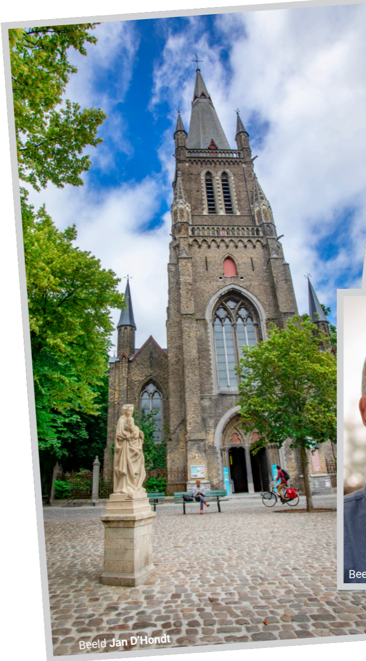
Beeld Jan D'Hondt