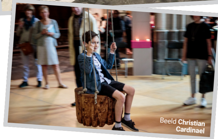
Beeld Christian Cardinael

Jezusfiguur. We zeggen de bezoeker niet voor waarover het kunstwerk gaat, maar stellen via onze audiogids vragen aan de luisteraar. Kerken zijn als unieke publieke ruimtes plaatsen van 'ongerichte aandacht'. Anders dan in een museum wordt de blik niet gestuurd, maar kan je elke dag nieuwe dingen ontdekken en nieuwe mensen ontmoeten. Het spel van het licht in de figuratieve glasramen, eigen aan de katholieke traditie, maakt dat de kerk op elk moment van de dag anders is.