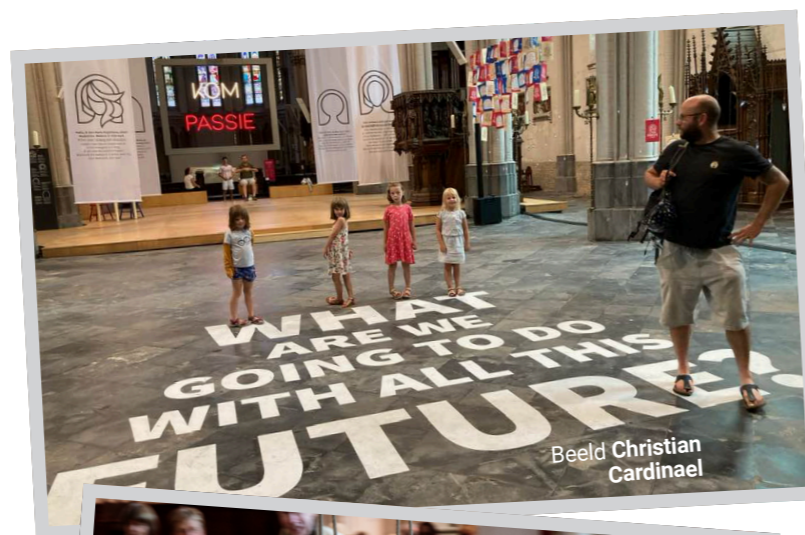
Beeld Christian Cardinael