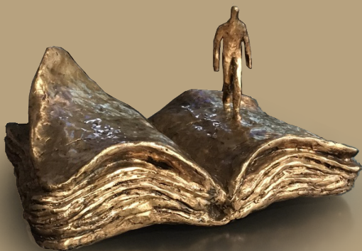
Bronzen beeldje van Iris Le Rütte

Afscheid is niet geconcentreerd op één moment. De beleving ervan is elke dag anders en bij momenten heel intens. Ook op zo'n moment, waar de pijn opflakkert, kunnen wij helpen bij het vormgeven van een ritueel dat verzacht.