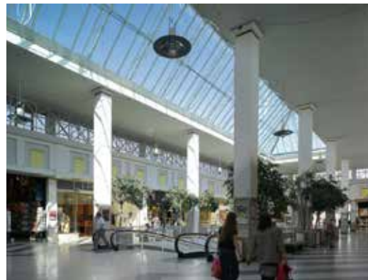
Belle-Ile Shopping Center / Luik