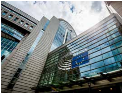
Europees Parlement / Brussel

Enkele referenties. Meer Umisol-projecten kan u vinden op onze website.