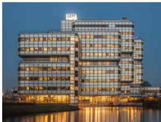
IBM / Amsterdam